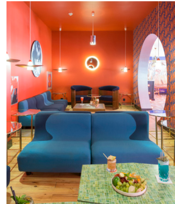
La Guitoune - Pyla sur Mer